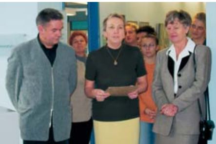
Eröffnung des Soziokulturellen Zentrums am 25.10.2001

gung steht. Neben sozialen, psychosozialen und kulturellen Einrichtungen wie einer Theater-Probenbühne ist Raum für wechselnde kulturelle Veranstaltungen vorhanden. Die Bewohnerinnen und Bewohner des Quartiers haben auch die Möglichkeit, Mehrzweckräume kostengünstig zu nutzen, z.B. für Familienfeiern. Mit dem »Netzwerk Füreinander – Miteinander« und der »Freiwilligenagentur«, sind Akteure des Programms eingebunden, die sich die Vernetzung bestehender Initiativen im Stadtteil und die Aktivierung von Bewohnerinnen und Bewohnern zum Ziel gesetzt haben. Das starke Interesse und die hohe Besucherzahl seit der Einweihung im Oktober 2001 zeigen die positive Resonanz, die dieses Stadtteilprojekt erfährt.