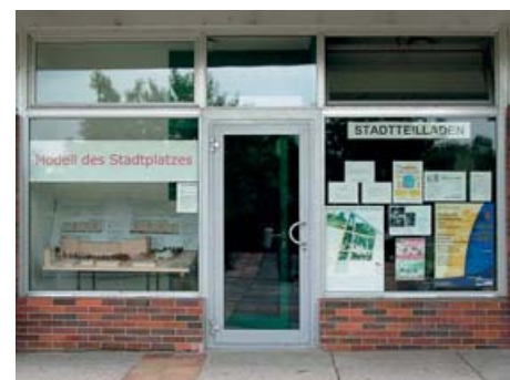
Stadteilladen an der Gelsenkirchener Allee