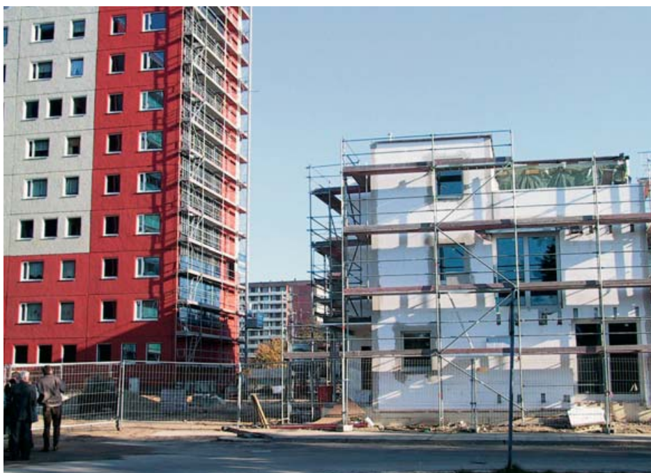
Entwicklungspotenzial Stadtumbau: Wiederverwendung von abgebrochenen Plattensegmenten für die Errichtung von Stadtvillen

sen für die Umgestaltung zu aktivieren und in diese einzubinden. In generationenübergreifenden Aktivitäten können dabei die vielen jungen Menschen eine wichtige Rolle übernehmen, auch wenn das Gebiet für sie oft ein »Durchlauferhitzer« während der Ausbildungs- und Haushaltsgründungsphase bleiben wird.