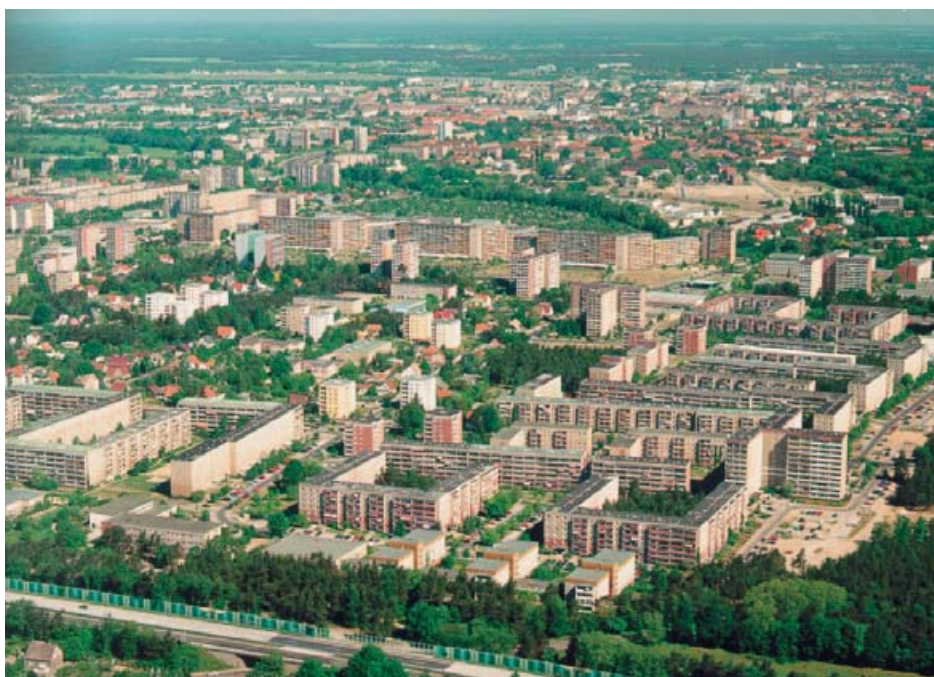
Östlicher Teil des Modellgebiets mit der »grünen Mitte«