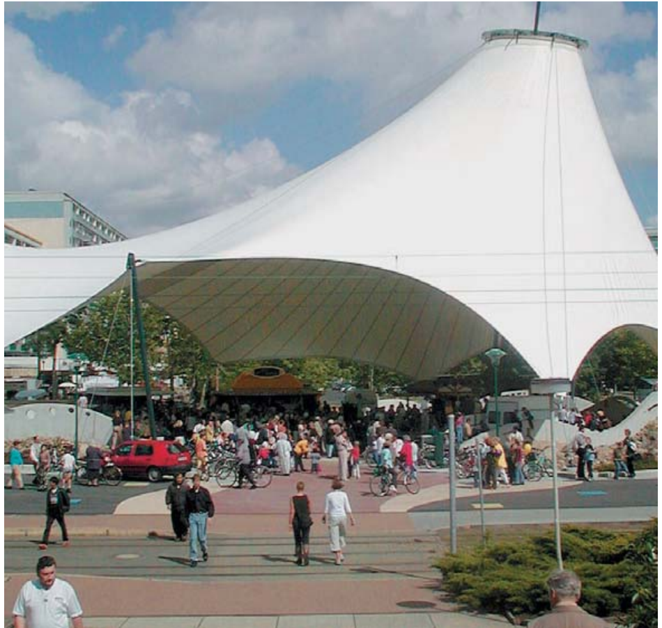
Einweihung des neu gestalteten Stadtplatzes beim Bürgerfest 2001

Dennoch ist eine gezielte Aktivierungsarbeit unerlässlich, um eine breite Beteiligungskultur zu etablieren. Mit der Einrichtung eines Stadtteilmanagements wurde der wesentliche Grundstein hierfür gelegt. Zukünftig wird stärker auf eine aufsuchende und zielgruppenspezifische Beteiligungsarbeit sowie eine breite Öffentlichkeitsarbeit gesetzt, z.B. durch Mitarbeit in der viel gelesenen Stadtteilzeitung sowie über weitere Printmedien und das Internet. Wie bisher sollen die jährlichen Stadtteilstefte, die der »Bürgerverein« organisiert, und Bürgerversammlungen zu wichtigen den Stadtteil betreffenden Themen, zurzeit insbesondere Wohnungsrückbau, Kernstücke der Beteiligungskultur sein. Die über den Prozess der Rahmenplanung seit einigen Jahren entstandenen Arbeitskreise werden fortgeführt und deren Ergebnisse aktiv in die Stadtteilentwicklung eingebracht. Hinsichtlich Außenwahrnehmung und Bekanntheit dieser Partizipationsangebote lässt sich allerdings noch vieles verbessern. Hierin liegt eine wesentliche Aufgabe des »Netzwerks Füreinander – Miteinander«. Mit Unterstützung durch das Sozialamt sollen im Zuge des Programms »Soziale Stadt« die bereits vorhandenen Strukturen für die Entwicklung des Stadtteils verstärkt nutzbar gemacht werden.