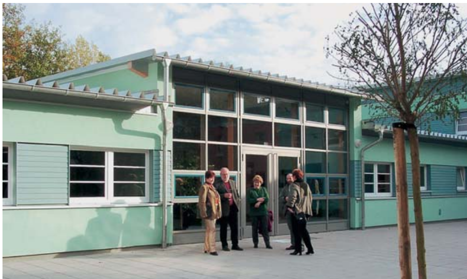
Zum Soziokulturellen Zentrum umgebaute ehemalige Kindertagesstätte im Quartier Turower Straße

Information, persönliches Management der Rückbaumaßnahmen und Umzugsmanagement sind in diesem Zusammenhang wesentliche Ansätze für die Vertrauensbildung. Gleichzeitig zeigen modellhafte Sanierungen und sinnvolle Nachnutzungen der frei werdenden Flächen, welche räumlichen und sozialen Visionen Realität werden können. So entstehen entlang des zentralen Boulevards helle, geöffnete Fassaden im Bestand der großen Wohnscheiben, ebenso Stadtvillen aus recycelten Platten, die Wohnraum entsprechend den veränderten Wohnwünschen anbieten.