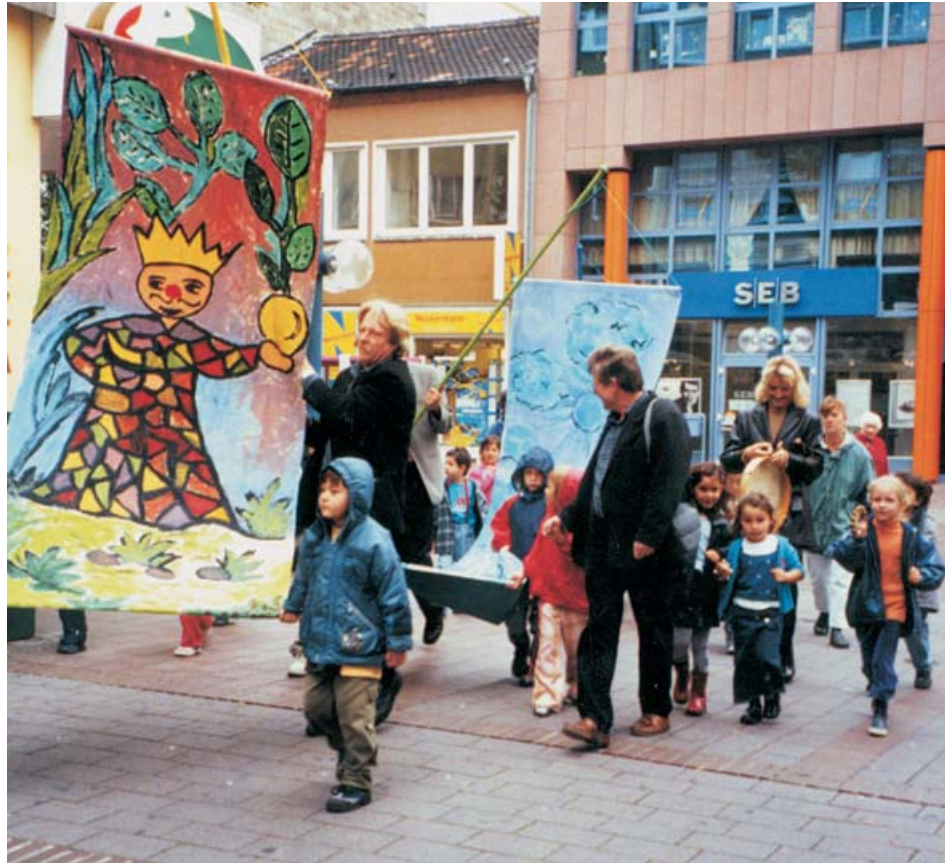
Fahnenprojekt: Kinder (be)malen ihre Welt.

die die Vorbereitung und Organisation verantwortlich übernahmen. Diese Methode hat sich in der Vergangenheit sehr bewährt. Nicht bewährt hatte sich mangels Interesse dagegen eine Zukunfts- bzw. Planungswerkstatt mit Jugendlichen zur Gestaltung von Freiflächen im Quartier. Als unmittelbar beteiligungsorientierte Aktivitäten sind beispielsweise die Kinderkonferenz oder auch die Aktion »Sauberes Westend« zu nennen.