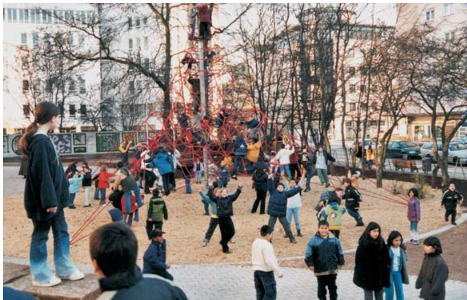
Neue Schulhofgestaltung: großer Pausenspaß

le vorgestellt wurden. Die Kinder diskutierten ihre Vorschläge mit Vertreterinnen und Vertretern der Stadt. Heute kann ein Ergebnis der Konferenz be- sichtigt werden: der neue Schulhof, der im Dezember 2001 eingeweiht wurde. Zu sehen sind auch die ersten Modernisierungsmaßnahmen an den Ge- bäuden der Wohnungsbaugesellschaft GAG, die für eine deutliche Anhe- bung des Wohnstandards und eine Aufwertung des Gebiets sorgen. Neben der Sanierung und Zusammenlegung von Wohnungen findet vor allem das »Balkonprogramm« großen Zuspruch in der Bevölkerung. Mit dem Anbau von modernen Balkonen in Stahl- oder Aluminiumkonstruktion an GAG-Gebäu- den soll eine schnelle und spürbare Verbesserung der Wohnqualität erreicht werden. Positiv hervorzuheben ist dabei auch die Tatsache, dass die GAG das Prinzip der Beteiligung mitträgt und an die Auswahl der Balkone und der Gebäudefronten Informations- und Abstimmungsprozesse mit den Bewohne- rinnen und Bewohnern gekoppelt hatte.