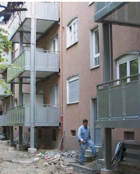
Balkonprogramm Endlich Frischluft – deutlicher Gewinn an Lebensqualität